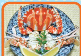
シマイシガニの蒸しがに