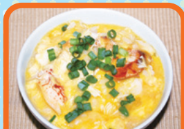
シマイシガニの雑炊

「とらがに」というカニをご存知ですか？ 標準和名はシマイシガニです。カニのトレードマークといえば、はさみ。つまり、Vサインですよ。シマイシガニは背中に黄色と黒のトラ模様があることから、「とらがに」と呼ばれています。ということは、トラがVサイン？ 私の愛する阪神タイガースのために生きているようなカニではありませんか。阪神優勝のあかつきには、とらがにパーティーで祝いたいですね。しかし、生き物には個体差というものがあります。シマイシガニは、10匹中7〜8匹は、つまり大半は黄色と黒ではなくオレンジ色と黒なんです。それ